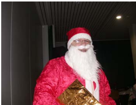
der Nikolaus schaute auch vorbei

Ein rasantes Programm erwartete die Gäste. Die Flöckchen trugen einen gewichtigen Teil zur tollen Stimmung bei, nachdem das Schnäuzer - Duo das Eis gebrochen hatte. Der Nikolaus, der einem Immekepler Tankstellenpächter erstaunlich ähnelte, durfte natürlich ebenso wenig fehlen wie die große Tombola.