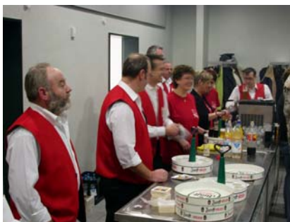
Die Freunde der KG RW Falkenhof

Ein rasantes Programm erwartete die Gäste. Die Flöckchen trugen einen gewichtigen Teil zur tollen Stimmung bei, nachdem das Schnäuzer - Duo das Eis gebrochen hatte. Der Nikolaus, der einem Immekepler Tankstellenpächter erstaunlich ähnelte, durfte natürlich ebenso wenig fehlen wie die große Tombola.