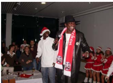
Die Flöckchen hatten Verstärkung